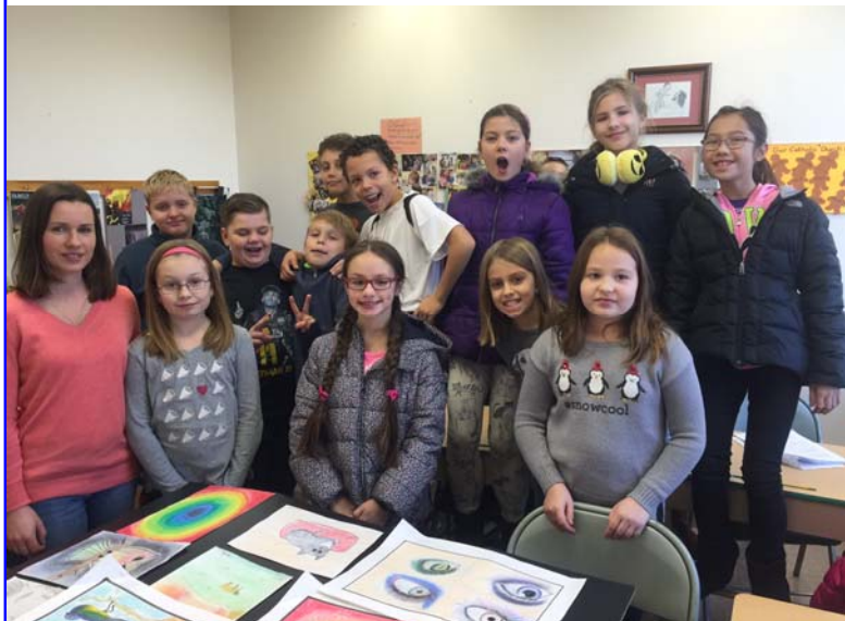
Wystawa rysunków Emilki Rembisz